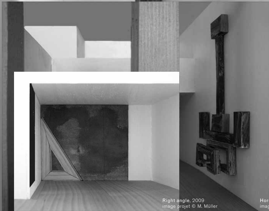
Right angle, 2009 image projet © M. Müller